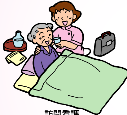
訪問看護 (療養上のお世話)