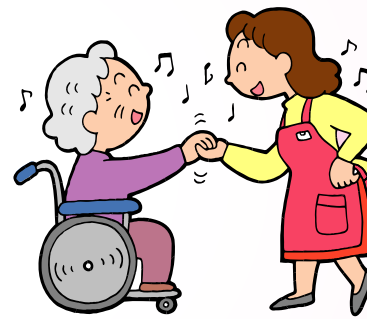
通所サービス・短期入所サービス (施設での日帰り・宿泊サービス)