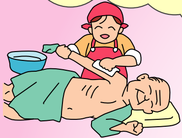
訪問介護 (食事や排泄のお世話)