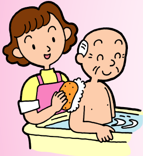
訪問入浴 (自宅での入浴介助)