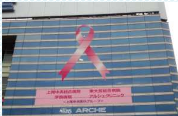
大宮アルシェ壁面に巨大ピンクリボン出現!!